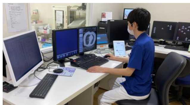
CTのコンソール風景 ORiGEN端末は常にCTのコンソール横に設置