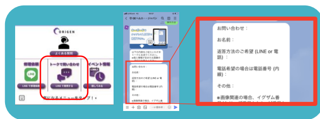
LINE GEヘルスケアへの問い合わせ画面

最も活用している機能はLINEです。LINEのリッチメニューにある「トークで問い合わせ」機能を用いて、サービスの方に装置の状態を遠隔で確認してもらったり、アプリケーションの方と検査の進め方等の相談をさせていただいています。導入当初は、装置の使用方法に慣れていなかったため、LINE機能を用いて質問をすることによって、後から回答を見返したり、他のスタッフに共有することもでき、大変助かりました。エラー発生時には、タブレット端末のカメラ機能でエラー画面を撮影し添付することで、サービスの方と円滑に情報共有できました。また、緊急度を発信することで電話での回答、またはLINEでの回答と使い分けができるため、技師1名で検査の担当をしている当院は、非常に助かっています。